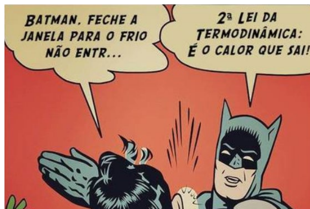
Conteúdo de física trabalhado no meme.

Meme já faz parte da cultura jovem e é uma forma de expressão que pode ser usada pelos professores na produção de conteúdo