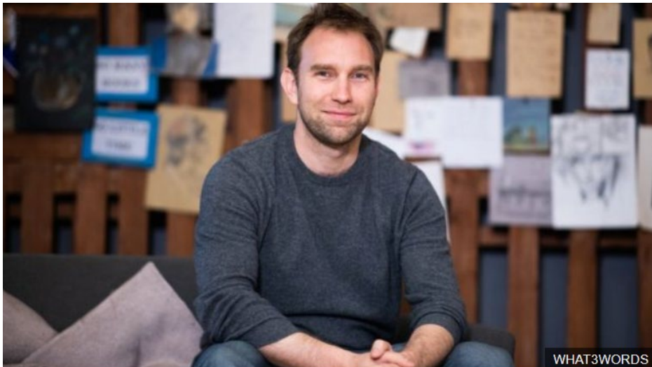
Chris Sheldrick fundou what3words em 2013 após enfrentar problemas pessoais com entregas de correspondências e pontos de encontro de bandas nos locais dos shows (Fonte: https://www.bbc.com/portuguese/geral-49353306 . Acesso em 18 de agosto de 2019.)

19. Na íntegra da notícia, são citados nomes de empresas/marcas que já estão usando o what3words. São elas: